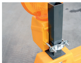
met adapterstuk en lamp