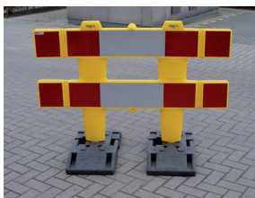
Polgard met Rubbervoeten