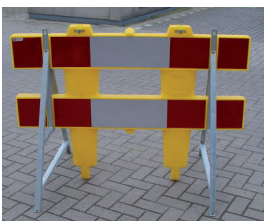
Polgard met A-steun